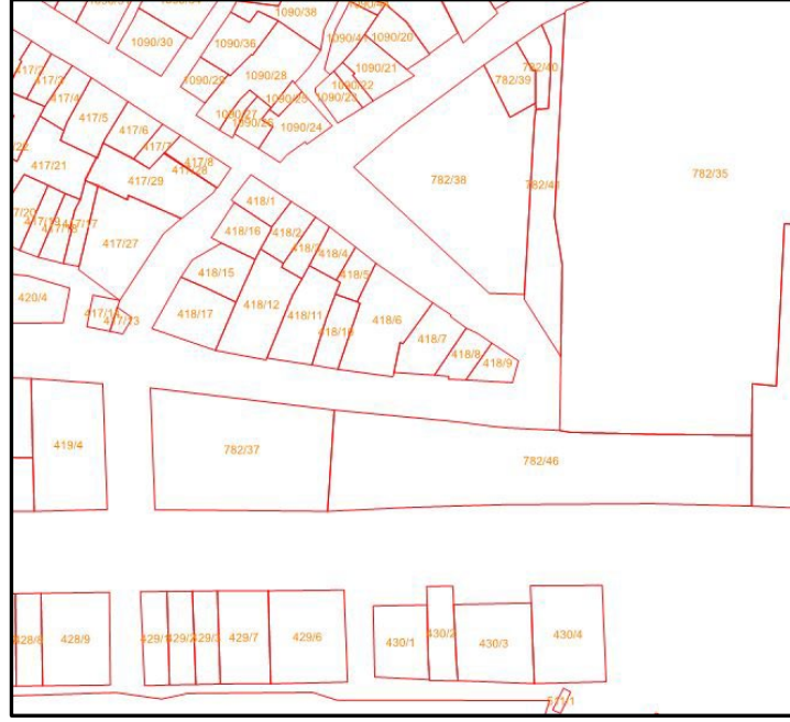
Şekil 3- Onaylı İmar ve Halihazır Durumu