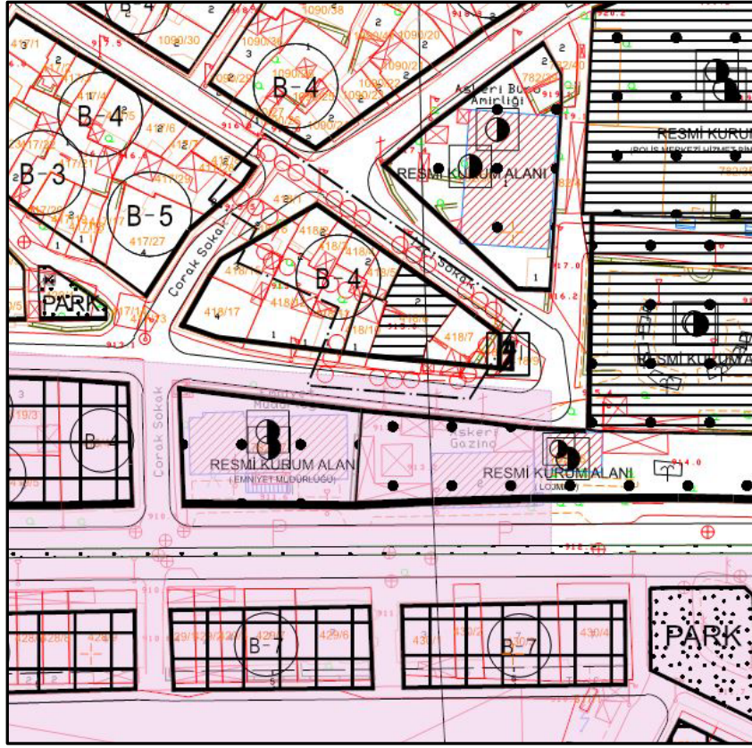
Şekil 3- İmar Planı Değişikliği