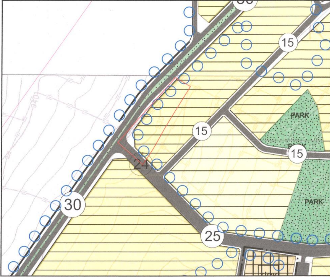
Tablo 1: Planlama Alanı Mülkiyet Durumu Tablosu